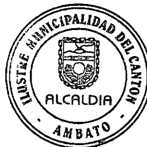
Arq. Fernando Callejas Barona ALCALDE DE AMBATO