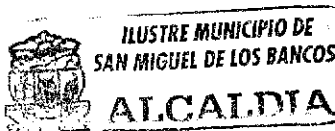
Marco Calle Ávila ALCALDE DEL CANTÓN SAN MIGUEL DE LOS BANCOS