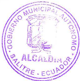
Sr. Francisco León Flores ALCALDE DEL CANTÓN SALITRE