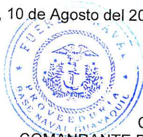
Luís VAYAS López Capitán de Navío-EM COMANDANTE DE LA BASE NAVAL DE GUAYAQUIL