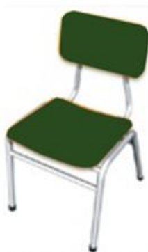
Perspectivas de las sillas