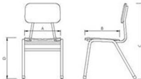
Fachada frontal y lateral de la silla